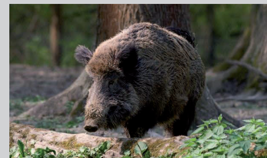
Fotogruppe Kontraste: Wildschwein von Günter Leffler

Ein Märchen wird wahr, das waren meine Gedanken als ich zum allerersten Mal den Reinhardswald betrat. Schon auf den ersten Metern kamen wir aus dem Staunen nicht heraus: Baumwurzeln, die sich ihren Weg weit über dem Waldboden suchten, eingehüllt in eine leuchtend grüne Moospackung, wie gemacht für eine Koboldwohnung. Das Herbstlaub leuchtete in einer Vielfalt, wie selbst berühmte Maler sie auf ihrer Farbpalette nicht schöner mischen könnten. Was gibt es Schöneres als im Wald zu sein, wenn die Sonne durch die Zweige und Blätter leckt oder wenn es langsam Nacht wird und vom nahegelegenen Tierpark das Heulen der Wölfe herüberschallt. (Birgit)