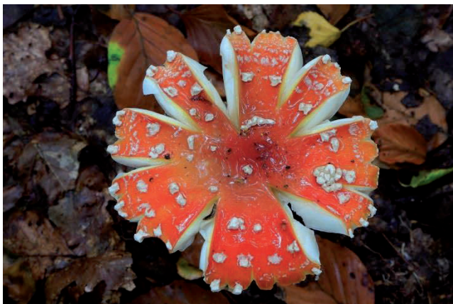
Fotogruppe Kontraste: Pilz von Edith Bauseler

Birgit Fabich Bernhardstraße 2 48336 Sassenberg Telefon 0 54 26 / 52 88 www.fotogruppe-kontraste.de