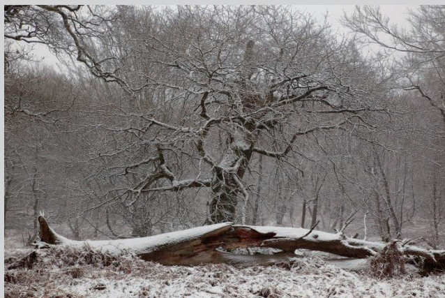
Fotogruppe Kontraste: Baum von Ralf Vornholt